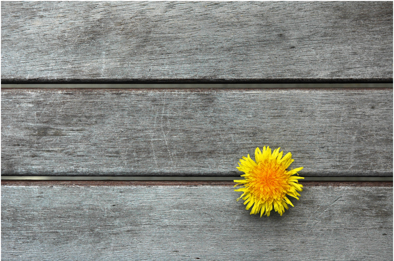
La règle des tiers by fd

Pour une composition harmonieuse, je vous recommande d'utiliser la règle des tiers , qui aura pour effet de donner plus de dynamisme à votre photo.