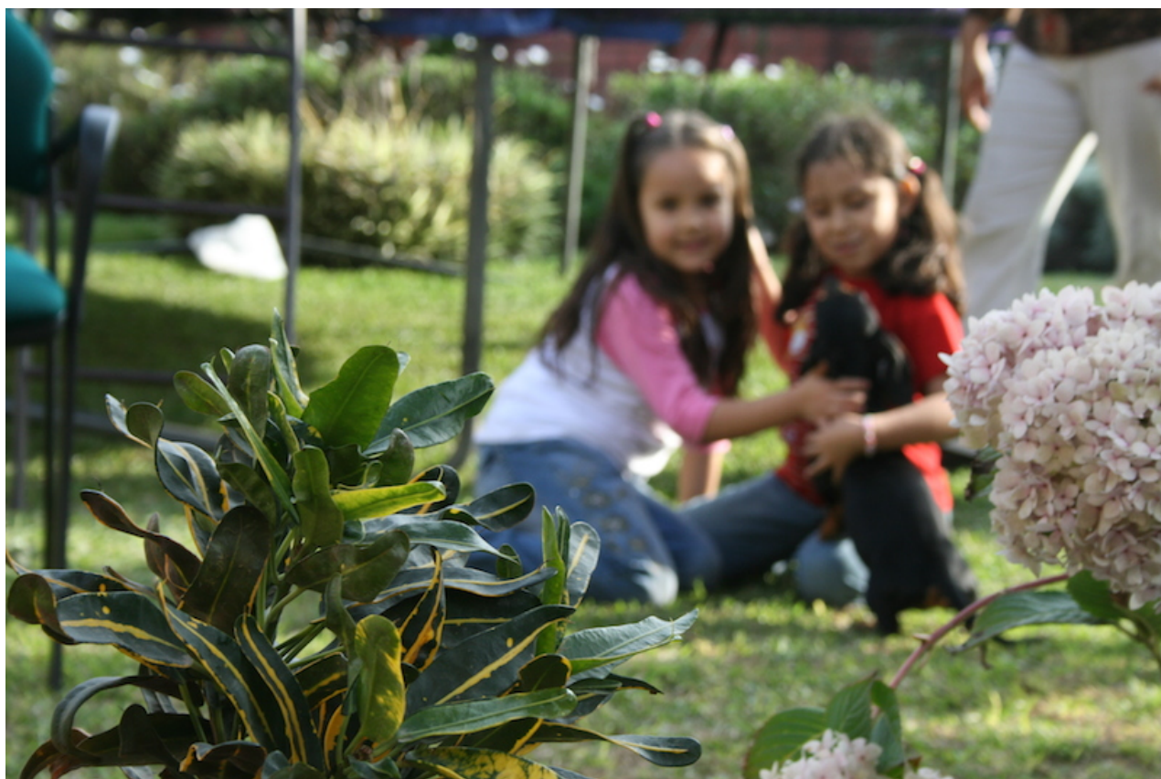
Bea & Grace

Un mauvais choix de mode autofocus ou de collimateur peut être la source d' une mise au point ratée.