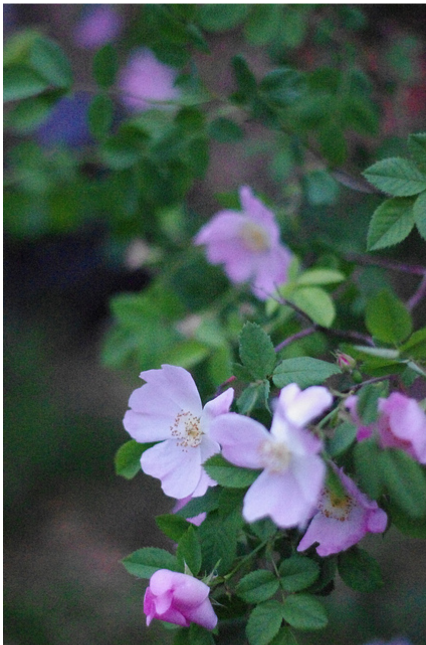
Photo prise à 12800 isos. aucun intérêt puisque les fleurs ne bougent pas en général, sauf en cas de rafales 😊

Avec de l'expérience, vous arriverez à juger quelle valeur choisir en fonction des conditions de lumière.