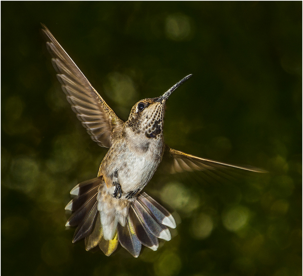
The Leader Of The Choir by Bill Gracey .

A l'inverse, si vous souhaitez photographier un paysage alors que vous êtes en mode priorité à la vitesse, ce n'est pas trop grave mais pas vraiment approprié , car pour ce type de photo, vous avez besoin d'une grande zone de netteté. De plus, votre sujet n'est pas en mouvement 😊 Ce n'est donc pas le bon mode de prise de vue.